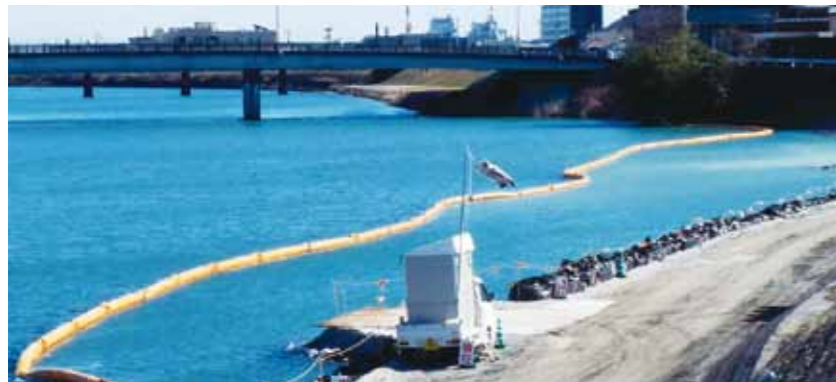
国土交通省発注の阿南市桑野川での堤防護岸工事施工

シルトフェンスは、「汚濁防止膜」や「汚濁水拡散防止膜」とも呼ばれ、河川工事や湾岸工事、湖やダム工事現場で発生する汚濁水または不純物の入った水の拡散を防止（低減）する特殊フェンスです。国内の河川では、近年、流域の汚水処理施設の普及により、順次水質が改善されつつあります。シルトフェンスは環境保護の観点から、河川や港湾などの工事現場に設置すべきものだと考えられています。