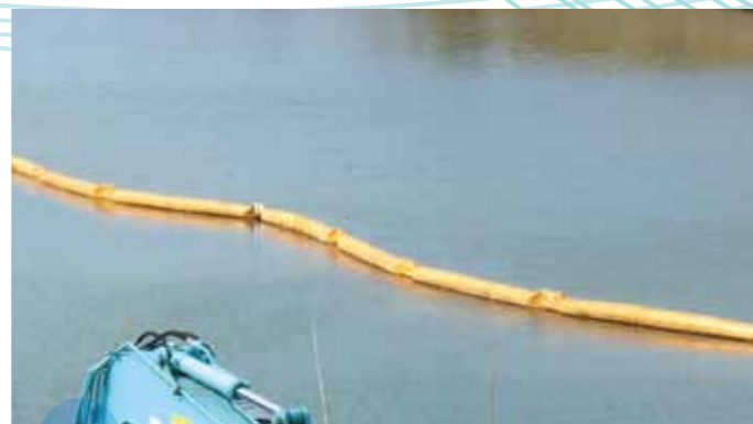
TYPE AS-30 垂下式シルトフェンス 穏やかな海域または湖沼などの工事に使用されます。