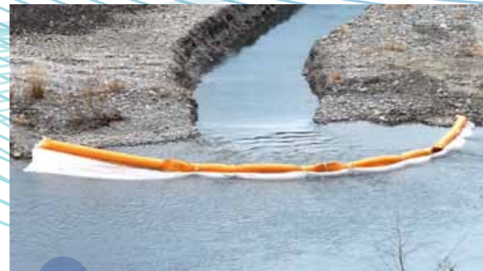
TYPE AS-30 垂下式シルトフェンス 河川内の工事に使用されています。